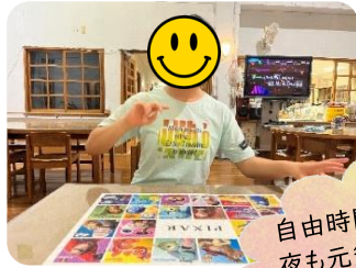
自由時間の様子 夜も元気いっぱい! 好きな遊びを見つけ 賑やかな寄宿舎