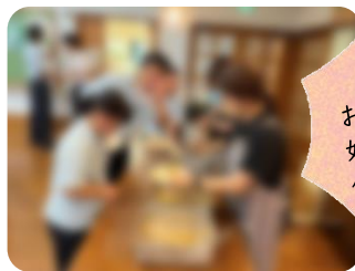
温かくて、 ボリューム満点の舎食! おかわりも大人気です! 好き嫌いなく食べて丈夫な体を 作りましょう。 お気に入りのメニューは 何かな??