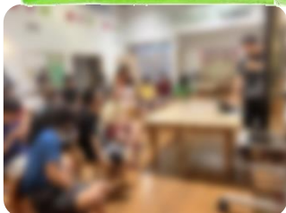
日課オリエンテーション