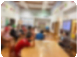
食事オリエンテーション

集団生活をする上で大事なルールやマナーを学びます。また、これから長い舎生活がスムーズに送れるように、質問したり確認したりします。経験生は、新入舎生に教えてあげたり、再確認できた会となりました。新入舎生は、これから、徐々に慣れていきましょう!