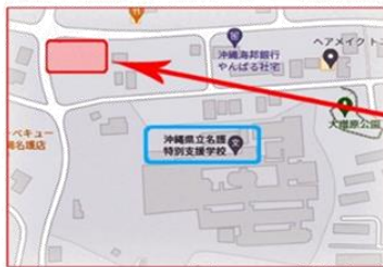
【学校の 上側にある 空き地です】

地震・津波等で避難した場合 「最終避難所」での 引き取りとなります。 下図の確認をお願いします。 *火災時は 本校グラウンドになります。